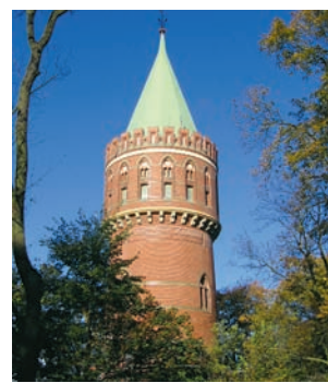
Zabytkowa wieża ciśnieniowa

Przedsiębiorstwo stawia na nieustanny rozwój, którego główne kierunki wyznaczają inwestycje, bezpośrednio przyczyniające się do zwiększenia liczby odbiorców usług. W tym zakresie największe nakłady przedsiębiorstwo poniosło z tytułu projektu uzbrojenia przemysłowych terenów inwestycyjnych, w strefie byłego lotni-