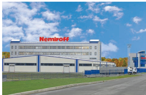
Ukraińska fabryka Nemiroff

Standardowo czyste wódki na świecie produkowane są z żyta lub z ziemniaków. Na Ukrainie, od pokoleń, wódkę wytwarza się wyłącznie