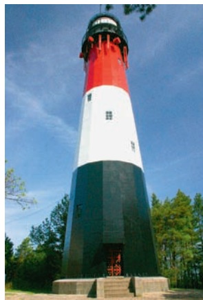
Latarnia morska Stilo

Wizytówką gminy jest, jedna z najpiękniejszych na Kaszubach, 32-metrowa latarnia mor-