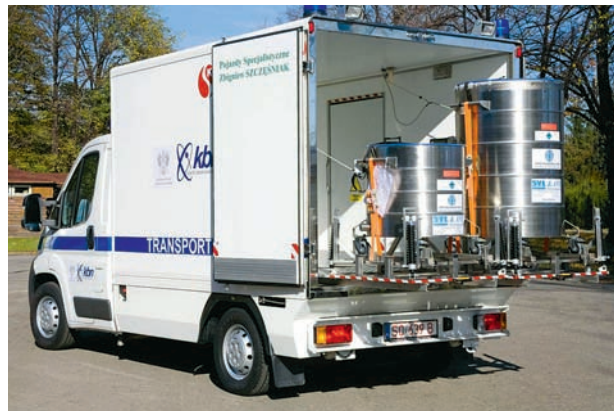
Samochód do transportu tkanek i narządów

jednostki Państwowej i Ochotniczej Straży Pożarnej, jednostki ochrony przeciwpożarowej Wojska Polskiego oraz w licznych zakładach i jednostkach straży pożarnej i przedsiębiorstw naszego kraju (m.in. PKN Orlen, Rafineria Czechowice, Rafineria Trzebinia, Kopalnia Bełchatów, PGNiG). Znaczą-