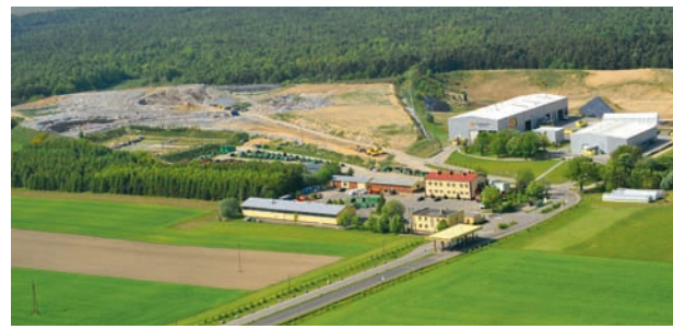
PGK Sp. z o.o. w Słupsku – Zakład Unieszkodliwiania Odpadów w Bierkowie

Służby PGK świadczą usługi, stanowiące gwarancję estetyki miast i gmin. Obszarem działania firma obejmuje 12 gmin i 3 powiaty woj. pomorskiego i zachodniopomorskiego.