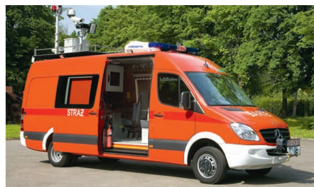
Lekki samochód dowodzenia i łączności

Posiadanie własnego biura konstrukcyjnego i badawczo-rozwojowego zaowocowało pozyskaniem kilkunastu polskich certyfikatów (w tym jako pierwsza w branży System Zarządzania Jakością ISO 9001:2000), System Zarządzania Jakością AQAP 2110:2006 (dla dostawców sił zbrojnych NATO), Certyfikat NCAGE nr 1789 H dla