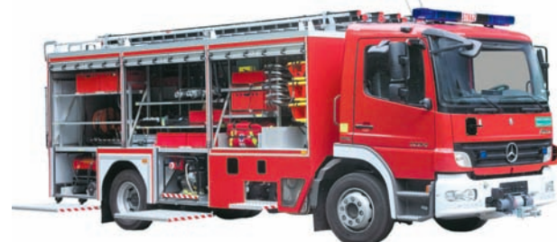
Ciężki samochód wsparcia technicznego

Jednym z najnowszych innowacyjnych kompleksowych rozwiązań, skonstruowanych przez przedsiębiorstwo jest prototypowy pojazd do transportowania tkanek i narządów do przeszczepów [patrz: zdjęcie wyżej]. Transport tkanek i narządów w Polsce odbywa się obecnie nieprzystosowanymi do tego celu samochodami osobowymi. Jedynym wyróżnikiem tego transportu jest jego specjalne oznakowanie. Tymczasem bielska firma skonstruowała i zbudowała specjalistyczny pojazd, który został (co zasługuje na szczególne podkreślenie) nieodpłatnie przekazany do użytkownika Bankowi Tkanek Działu Kriobiologicznego w Morawicy k. Kielec . Powstały na bazie Fiata Ducato samochód posiada konte-