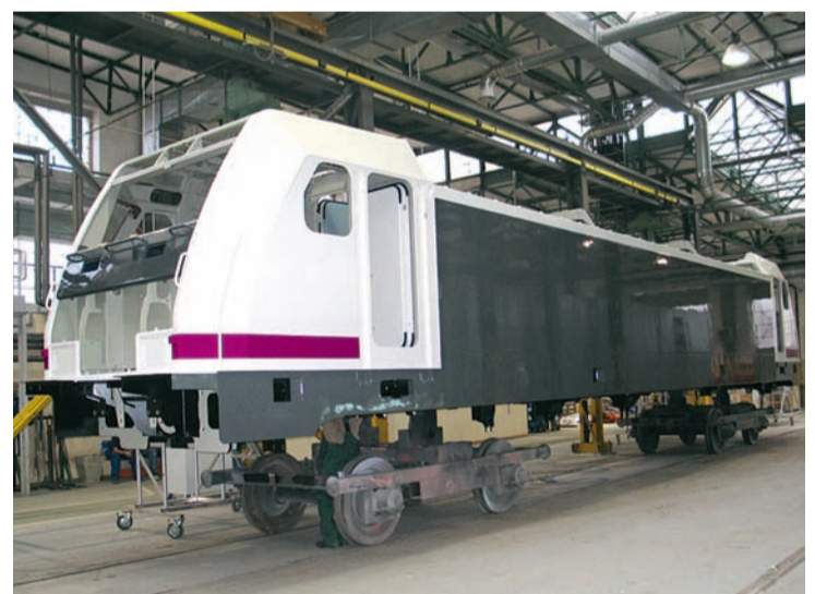
Pudło rodziny lokomotyw TRAXX przed wysyłką do klienta

Ten model zarządzania realizowany jest poprzez tzw. Team Concept, gdzie udziałem samych pracowników są idee dotyczące usprawnień, poprawy