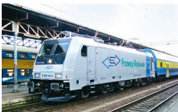
Lokomotywa elektryczna Bombardier TRAXX