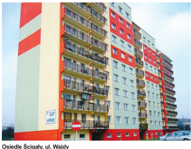
Osiedle Ścigały, ul. Wajdy

Atutem Katowickiej Spółdzielni Mieszkaniowej jest nie tylko wieloletni staż i bogate doświadczenie na rynku mieszkaniowym, lecz także doceniana jakość usług, czego wyrazem jest długa lista nagród, plasujących KSM w branżowej czołówce (m.in. tytuł Lidera Społecznej Odpowiedzialności Dobra Firma 2009, I miejsce w konkursie „Orły Polskiego Budownictwa 2009”, Certyfikat „Lidera Rynku” i „Euro Leadera”, Grand Prix 2008 w Ogólnopolskim Programie „Elita Zarządzania”, Wielka Nagroda Prezydenta Izby Budownictwa – z Laurem).