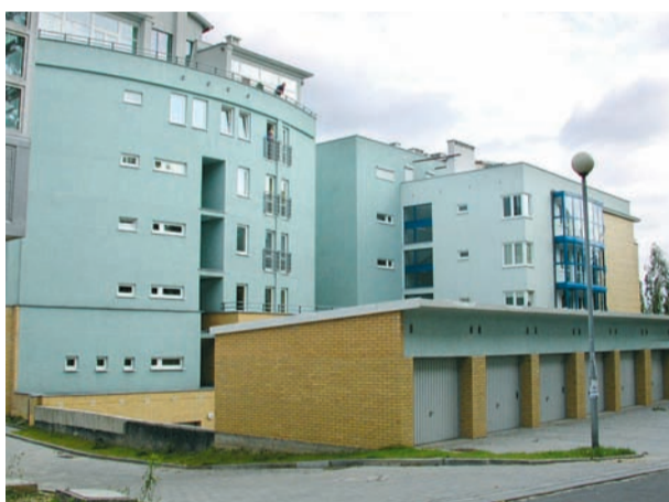
Osiedle Zgrzebniocka, ul. Łąbedzia

Katowicka Spółdzielnia Mieszkaniowa prowadzi działania na cele społeczne, m.in. w posta-