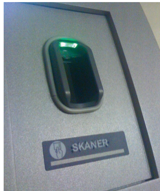
Skaner bankomatu biometrycznego

testów, wykazała szerokie możliwości i duże udogodnienia rozwiązania – podkreśla Prezes Wojtas. – Dodatkowym atutem bankomatu jest możliwość wyposażenia go w moduł do wypłacania monet. Pozytywne wyniki testów przyniosły decyzję o uruchomieniu na stałe na razie jednego bankomatu biometrycznego. W związku z jego dużymi możliwościami (w tym wypłaceniem pieniędzy z dokładnością do 1 grosza) został on udostępniony osobom pobierającym świadczenia socjalne i zasiłki. To pierwszy taki bankomat w Polsce. Już wkrótce kolejne będą sukcesywnie uruchomione w największych oddziałach Podkarpackiego Banku Spółdzielczego.