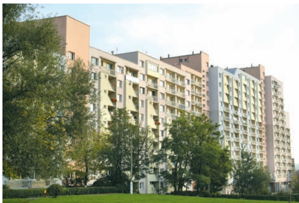
FALOWIEC przy ul. Ks. Gałeczki.

to niemal 40 tys. m 2 płyt asbestowych i azbestu. Większość projektu została sfinansowana ze środków własnych spółdzielni. Wsparcia udzielił także Wojewódzki Fundusz Ochrony Środowiska.