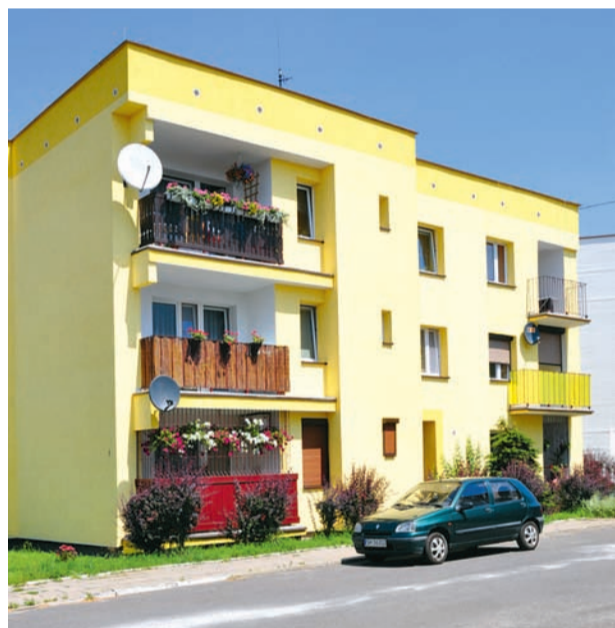
Ul. Rodziny Oswaldów

W tym roku zakończony zostanie program termomodernizacji zasobów. W jego ramach przeprowadzono m.in.: ocieplenie ścian zewnętrznych, wymianę stolarki okiennej oraz drzwiowej. Na ukończeniu są także prace, związane z likwidacją zagrożenia azbestowego. Z budynków w sumie usunie-