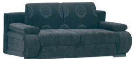
Autorski projekt pracowników MSP „DAB” – kanapa „Libero” (Złoty Medal Międzynarodowych Targów Poznańskich) – produkt nominowany w Programie Najwyższa Jakość QI 2010

Rocznie do produkcji trafia 50 nowych projektów, z których każdy posiada specjalistyczne atesty wytrzymałościowe. Materiały, z ja-