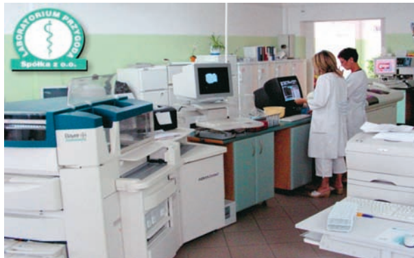
Pracownia biochemii i immunochemii

nie północnego Mazowsza (Płock, Żuromin, Sierpc, Kutno, Raciąż, Żychlin, Rypin, Bartoszyce, Toruń). W bieżącym roku miała miejsce przeprowadzka głównej siedziby firmy z Żuromina do Płocka. Wpłynęło to bardzo korzystnie na rozwiązania logistyczne, czego przykładem może być przeniesienie pracowni bakteriologicznej z Rypina do Płocka, przez co materiał mikrobiologiczny może być transportowany o wiele szybciej. Unowocześniono także punkt laboratoryjny znajdujący się w Sierp-