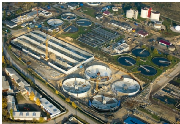
Oczyszczalnia Sitkówka w trakcie rozbudowy

przez firmę certyfikatem jakości ISO buduje także wizerunek firmy, co bezpośrednio przyczynia się do wzrostu zaufania klientów. Na wdrożenie systemu środowiskowego Wo-