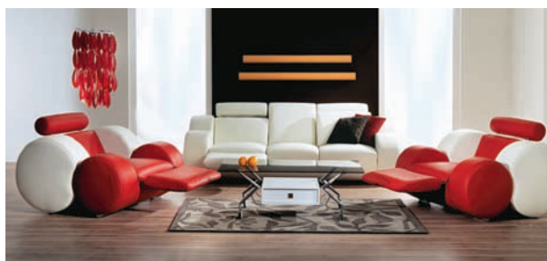
Zestaw San Diego

Strategią Fabryki Mebli Gawin, znajdującej się w czołówce polskich producentów mebli, jest dywersyfikacja i specjalizacja produktu. Firma koncentruje się głównie na produkcji mebli tapicerowanych, wysoko cenionych zarówno w Polsce jak i za granicą, lecz nie tylko. Jej dużym atutem jest zróżnicowanie oferty, obejmującej także zestawy kuchenne, meble pokojowe, sypialnie, a także stoły i krzesła. Mijający kry-