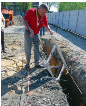
Montaż pionowych rozpor w wykopie

To jest dla nas standard, że klienta należy traktować na najwyższym poziomie. Stosujemy System Zarządzania Jakością zgodnie z normą EN 9001:2000, w celu uzyskania pełnej satysfakcji klientów, których mamy na terenie całej Polski, a także za granicą. System ten daje gwarancję odbiorcom, że nasze usługi są najwyższej jakości, a ich oczekiwania zostaną spełnione. Nasi dostawcy są starannie dobrani i wyselekcjonowani. Ponadto czas serwisu trwa maksymalnie do 48 godzin od zgłoszenia usterki, dzięki tzw. mobilnym punktom serwisowym – samochodom wyposażonym w profesjonalne narzędzia oraz odpowiednio wykwalifikowanym mechanikom. Firmę tworzy zespół zrębny, energiczny i kompetentnych ludzi. Przedstawiciele handlowi zawsze pełnią rolę doradcą. Wszyscy pracownicy odbywają regularne szkolenia, które przeprowadzane są najczęściej