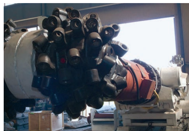
Kombajn chodnikowy AM50

Przy pomocy środków unijnych firma rozpoczęła również realizację pierwszego i unikalnego, w pełni zrobotyzowanego stanowiska do spawania uchwytnych nożycach urabiających kom-