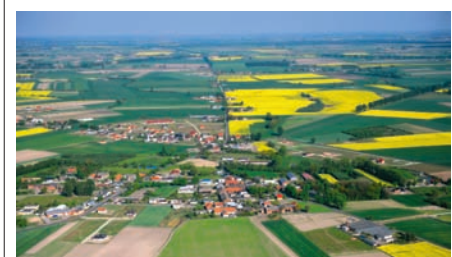
Gmina z lotu ptaka

Do silnego wzrostu gospodarczego i społecznego przyczyniają się przebiegające przez region trasy komunikacyjne: autostrada A-2