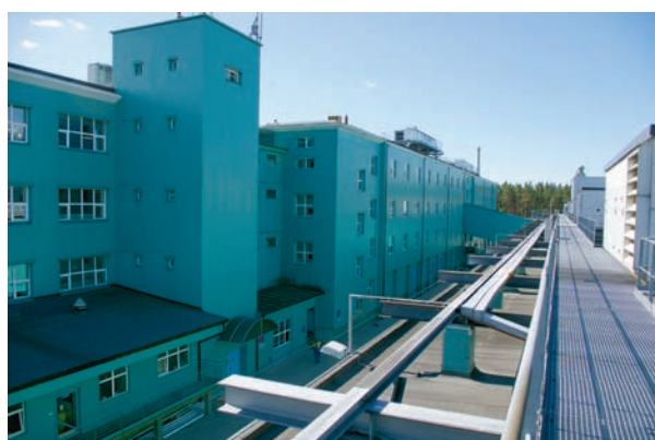
Budynki produkcyjne British-American Tobacco S.A. w Augustowie

Augustowska fabryka BAT należy dziś do najnowocześniejszych zakładów przemysłowych w kraju. Wszystkie obszary działania zakładu (m.in. procesy produkcji, dystrybucji i zarządzania) odbywają się w zgodzie z wdrożonymi standardami Zintegrowanego Systemu Zarządzania, obejmującego ISO 9001 (zarządzanie jakością), ISO 14001 (zarządzenie