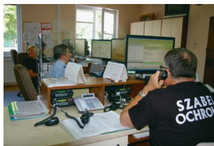
Alarmowe Centrum Odbiorcze

SZABEL posiada najbardziej rozbudowaną Specjalistyczną Uzbrojoną Formację Ochronną