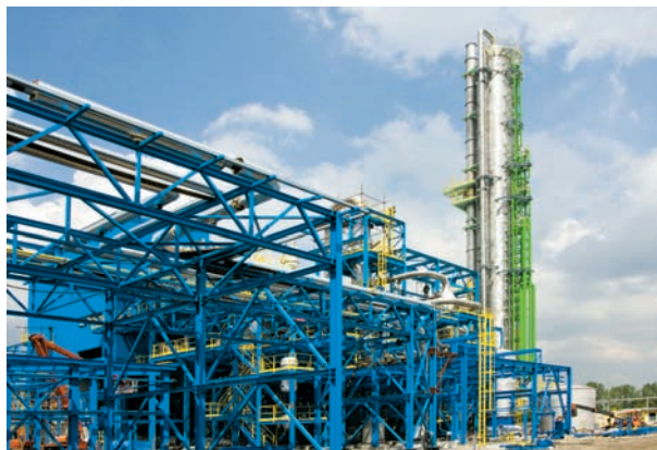
Instalacja kwasu azotowego TK V (czerwiec 2010)

Realizacja projektu pozwoli na uzyskanie efektu ekologicznego w postaci redukcji emisji szkodliwych związków,