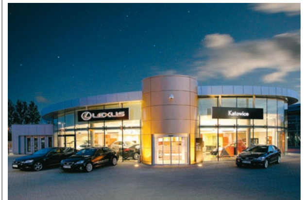
Salon Lexusa w Katowicach

Staramy się, aby sam moment przekazania kluczyków do auta nie był tylko obowiązkiem, ale stał się czymś wyjątkowym dla naszego klienta. Przede wszystkim w każdym salonie, także w naszym, mamy wydzielone specjalne pomieszczenie, gdzie następuje ostateczne przekazanie auta szczęśliwemu właścicielowi. Wydawanie samochodu jest ceremonią, inną w każdym salonie, ale jest to pewnego rodzaju święto. W naszym salonie każdy klient otrzymuje dopasowany do jego upodobań