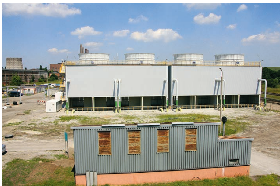
Chłodnia wentylatorowa instalacji TK V