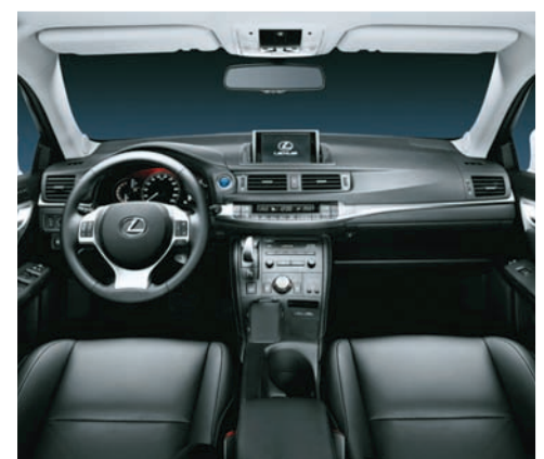
Lexus CT 200h