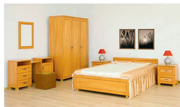
Zestaw mebli „GRENADA” do sypialni

Mimo nienajlepszej sytuacji w naszej branży, nie powinniśmy mieć powodów do narzekania. Solidnie przygotowując się do kryzysu odpowiednio wcześniej podjęliśmy szereg bardzo odważnych decyzji, których skutki powinny dać impuls do dalszego rozwoju firmy. Nie poddając się negatywnym nastrojom, panującym na rynku, konsekwentnie realizujemy założenia naszej strategii. Jej wyniki są widoczne. W bardzo krótkim okresie powiększyliśmy naszą sieć firmowych salonów, mając ich dziś ponad 200. W ślad za tym wzrosło zatrudnienie, które już dawno przekroczyło 1,8 tys. pracowników. Rozbudowując ofertę pro-