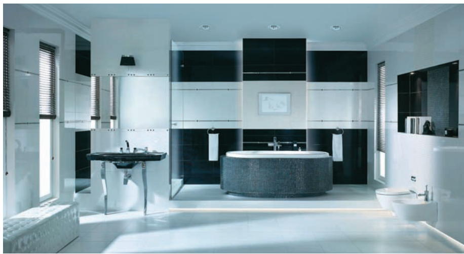
Kolekcja Secret Bianco

sowaniu najnowszych technologii, które, w połączeniu z zaawansowanym wzornictwem, gwarantują wysoką jakość produktu i oryginalne rozwiązania. – W poszukiwaniu nowych, światowych trendów, nie tylko uczestniczymy w najważniejszych targach przemysłu ceramicznego, ale np. także w targach odzieżowych czy pokazach mody, gdzie możemy zobaczyć trendy jakie obowiązywać będą w kolorystyce. Mobilizujemy