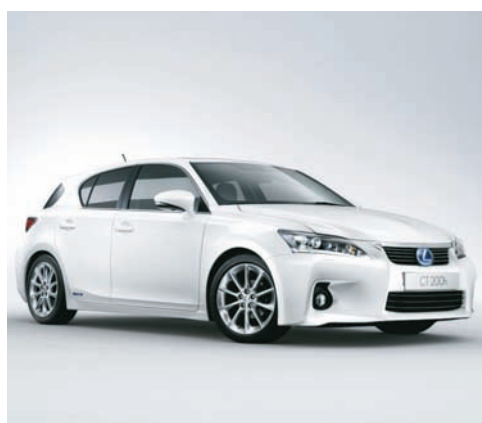
Lexus CT 200h