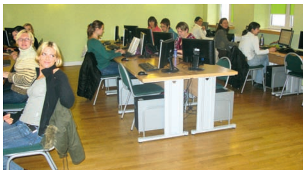
Zajęcia komputerowe w pracowni ZDZ

trum szkoleń i kursów lub podając naukę w szkołach różnego profilu i szerokości posiadających uprawnienia placówek publicznych. Niezależnie od stałego podnoszenia poziomu i jakości kształcenia, do programów nauczania wprowadzane są nowe, atrakcyjne kierunki i specjalności, których profil skorelowany jest z wymogami współczesnego rynku pracy. W szkoleniach, oprócz tradycyjnego sposobu przekazywania wie-