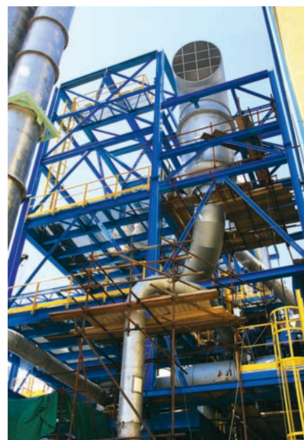
Konstrukcja instalacji TK V

Budowa Instalacji Kwasu Azotowego TK V to spełnienie nie tylko wymogów unijnych i zapewnienia bezpieczeństwa pracy i oszczędności energii.