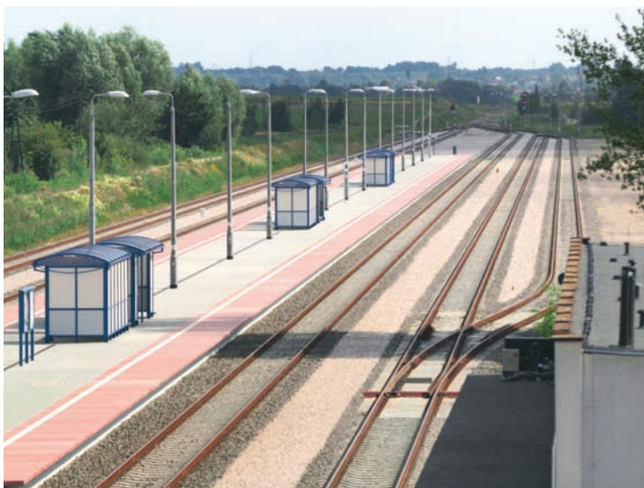
Stacja kolejowa Kolbuszowa

Kolejnym, znaczącym faktem w historii firmy był rok 2001, kiedy to na skutek komercjalizacji, przedsiębiorstwo państwowe przekształcone zostało w jednoosobową spółkę skarbu państwa. W roku 2009 w procesie prywatyzacji spółki została podpisana umowa sprzedaży akcji PRK w Krakowie S.A. pomiędzy Skarbem Państwa, a ZUE S.A. z siedzibą w Krakowie. W oparciu o treść umowy od stycznia 2010 roku ZUE S.A. stało się właścicielem PRK Kraków S.A.