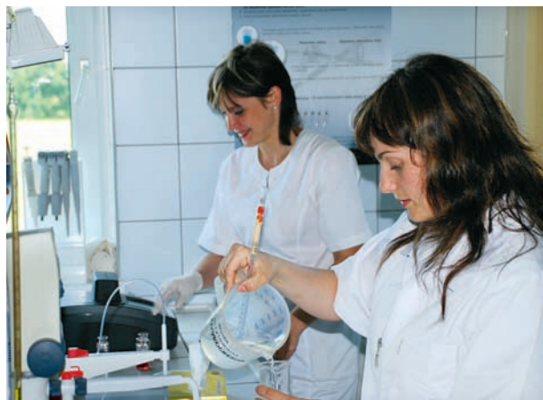
Laboratorium Badania Wody i Ścieków gliwickiego PWiK Sp. z o.o.

MEBLE Meble „GRENADA” nagrodzone złotym godłem QI 2010