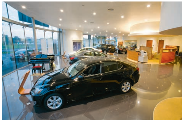
Jeden z salonów Lexusa