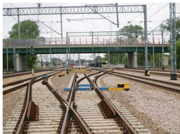
Stacja kolejowa Legionowo

W mojej ocenie różnice powoli będą się zacierać. Niewątpliwie czeka nas jeszcze bardzo dużo intensywnej i wzmoczonej pracy, zwłaszcza teraz, kiedy kolej przeżywa swój renesans. Jak we wszystkich działaniach biznesowych wymaga to dobrej organizacji, ale też działań z duchem zrównoważonego rozwoju i działań proekologicznych. Musimy dużo uwagi poświęcić na ulepszenia, inwestycję w nowoczesny sprzęt i tabor kolejowy. Ale także pamiętać, że wszystko co czynimy jest dla klienta, dla pasażera i jego wygody, a także ochrony środowiska, co wiąże się również z nakładami finansowymi na akustyczne zabezpieczenia, wycośnienie nawierzchni torowych i budowę ekranów dźwiękoszczelnych. Mam nadzieję, że tego typu działania przyniosą coraz większą liczbę pasażerów, którzy cenią sobie wygodę i komfort podróży. Ten typ komunikacji będzie się intensywnie rozwijał i wkład spółki w modernizację i ulepszenie struktury torowej kolei przyczyni się również do poprawy jakości usług świadczonych przez kolej. Moje życie zawodowe zawsze było związane z koleją, a od wielu lat z PRK Kraków S.A. i jestem przekonany, że ten rynek komunikacji czeka jeszcze świetlana przyszłość.