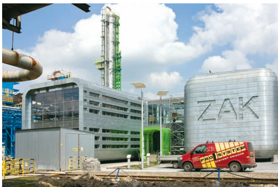
Budynek administracyjny z centralną sterownią instalacji TK V

o wydajności 900 ton na dobę oraz neutralizację kwasu azotowego w ilości 1,8 tys. ton na dobę. Kontrakt podpisano w kwietniu 2008 r. i miesiąc później przystąpiono do prac budowlanych. W czerwcu 2009 r. został wmurowany kamień węgielny, zwiastujący długoletni okres przygotowań.