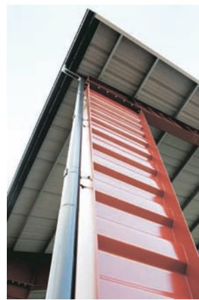
Rama Borga Frame™