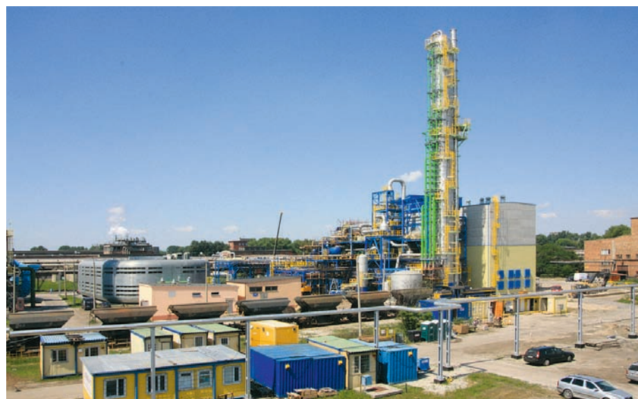
Instalacja kwasu azotowego TK V (czerwiec 2010)

środowiska, co tym samym przyniosło postawienie rygorystycznych wymogów zakładom przemysłowym.