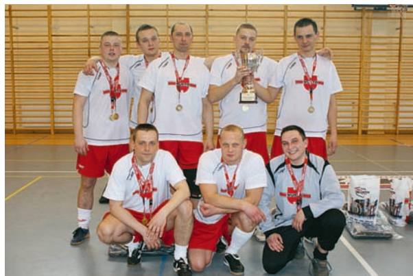
Zwycięzcy Trzeciego Turnieju Halowej Piłki Nożnej Würth (marzec 2010 r.)

Idea Olimpiad Specjalnych jest aktywnie wspierana przez spółki grupy Würth w wielu krajach. Grupa Würth jest partnerem Olimpiad Specjalnych w Niemczech, a jej pracownicy biorą licznie udział w wolontariacie. Nam w Polsce również zależy na tym, aby osoby z niepełnosprawnością intelektualną mogły cieszyć się i czerpać korzyści z uczestnictwa w zawodach sportowych. Dlatego zaangażowaliśmy się w organizację tegorocznej, największej imprezy sportowej tego typu w Polsce. Pracownicy Würth Polska nie