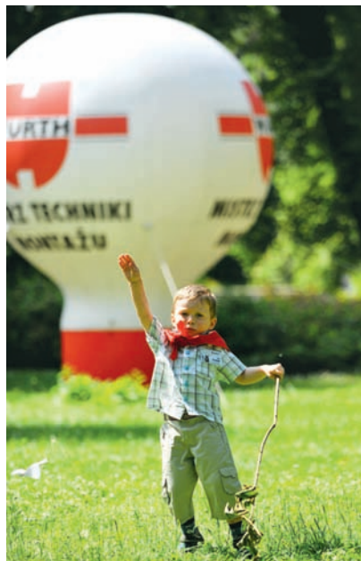
Impreza dla dzieci pracowników w warszawskim ZOO (czerwiec 2010 r.)