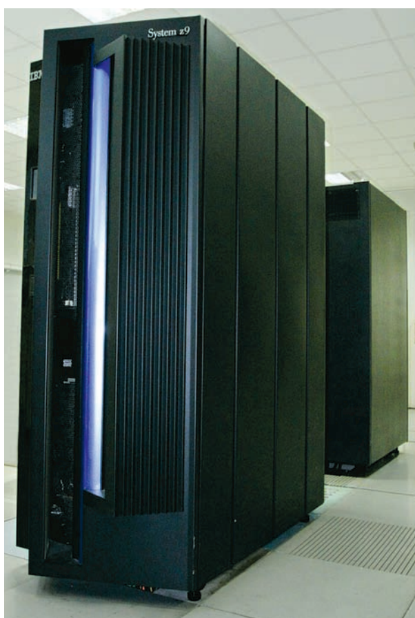
Jedna z maszyn „ZETO” – Server mainframe IBM z9

Oprócz tego „ZETO” projektuje, wytwarza i wdraża systemy informatyczne dedykowane dla: jednostek administracji samorządowej – elektroniczny system obiegu dokumentów „el-Dok System” oraz aplikacje powiązane: Elektroniczna Skrzynka Podawcza „el-Agent”, Elektroniczny Urząd „el-Urząd”, BIP, oraz Elektroniczne Archiwum „el-Archiwum”; sieci handlo-