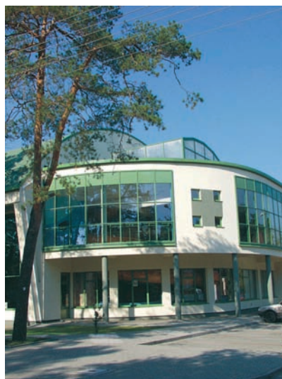
Integracyjne Centrum Sportu i Rekreacji w Józefowie