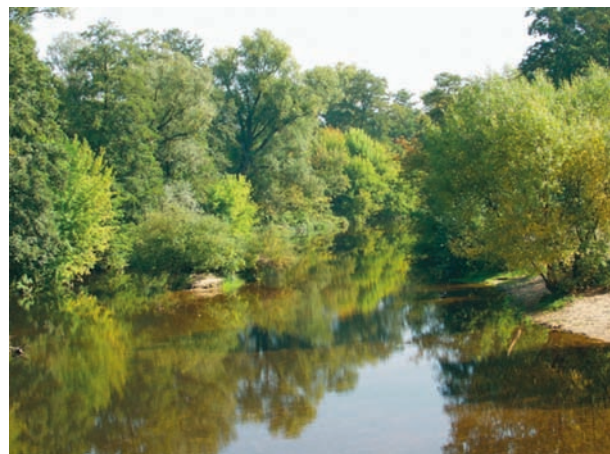
Józefów, rzeka Świder