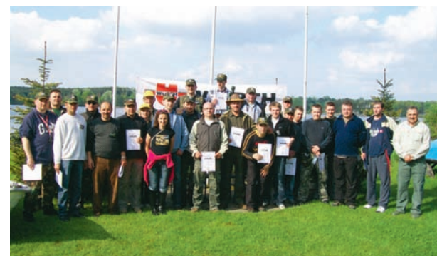
Zawody Wędkarskie Würth (maj 2010 r.)

Staraliśmy się również współpracować wolny czas naszych pracowników, poprzez wspieranie wspólnych wyjazdów, spotkań i sponsorowanie biletów do teatru lub opery. Od 2008 r. organizujemy cykliczne zawody wędkarskie dla pasjonatów wędkarstwa w naszej fir-