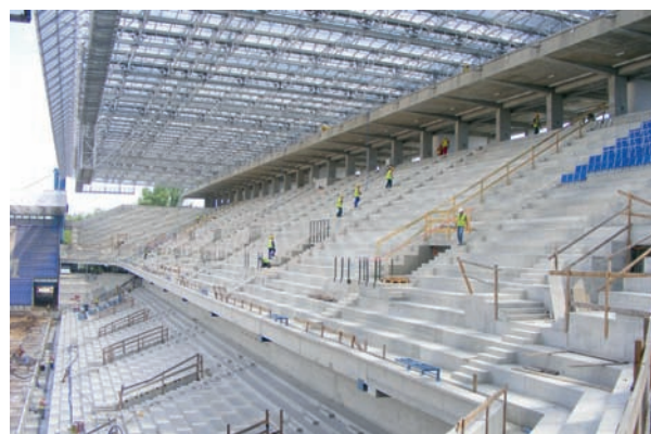
Stadion Wisły Kraków – Trybuna Wschodnia

Kolejnymi pracami, do których przystępuje Elektromontaż, dostarczając instalacji silno i słaboprądowych, są galerie