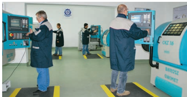
Pracownia dydaktyczna obrabiarek sterowanych numerycznie CNC w Tychach Zakładu Doskonalenia Zawodowego w Katowicach

Jednymi z najpopularniejszych szkół są licea ogólnokształcące z klasami wojskowymi, współpracującymi z policją i wojskiem; technikum lotnicze, w którym nauka odbywa się przy współpracy m.in. z Górnictwem i Hutnictwem