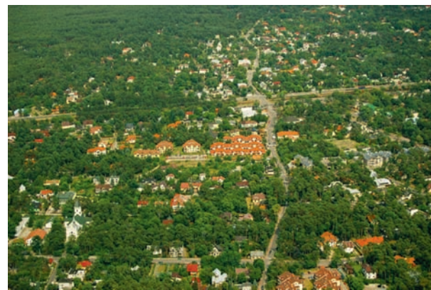
Józefów z lotu ptaka

niepełnosprawnych, składają się m.in.: kryta pływalnia z dwoma basenami, urządzeniami do hydromasażu, jacuzzi, 80-metrową zjeżdżalnią, siłownią, solarium, sauną, gabinetem masażu i kosmetyki oraz hala sportowo-widowiskowa z boiskiem do gry w halową piłkę nożną, siatkówkę, piłkę ręczną i koszykówkę. Z hali, oprócz uczniów józefowskich szkół, korzystają również sportowcy miejscowych klubów sportowych MLKS „Józefovia” i UKS „Victoria” Józefów. Odbywają się tu także liczne imprezy o charakterze kulturalnym (koncerty,