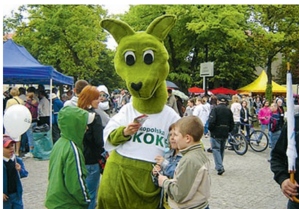
Maskotka WSKOK – Skaczący Kangur zawsze wzbudza duże zainteresowanie. Jest ozdobą wszystkich lokalnych imprez.

– Staramy się motywować pracowników do dalszej pracy. W Wielkopolskiej SKOK każdy ma szansę na awans, ponieważ pierwszeństwo przy rekrutacji na wszystkie stanowiska kierow-