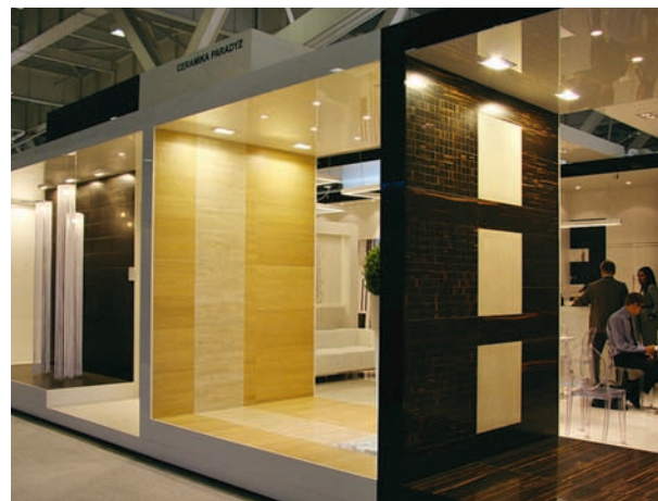
Ekspozycja Ceramiki Paradyż na Międzynarodowych Targach Ceramiki i Wyposażenia Łazienek „Cersaie 2010” w Bolonii

Prestiżowe nagrody branżowe są znakomitą rekomendacją przy zakupach, które realizuje sieć sprzedaży pośredniej. Również dla indywidualnego konsumenta laury, tytuły i wyróżnienia – zwłaszcza te związane z jakością – są dodatkowym argumentem, przemawiającym za wyborem płytek Ceramiki Paradyż. O każdej nagrodzie szeroko informujemy rynek. Rozumiemy, że dobra jakość naszych produktów jest ważną wartością, tworzącą zaufanie klientów do marki i firmy, która za nią stoi. W sytuacji kryzysu wielu światowych gospodarek,