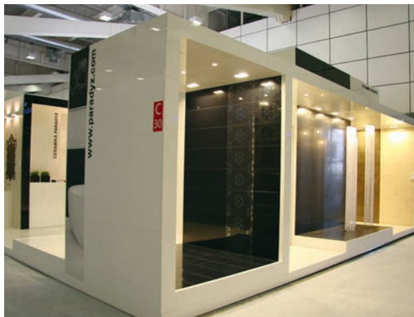
Ekspozycja Ceramiki Paradyż na Międzynarodowych Targach Ceramiki i Wyposażenia Łazienek „Cersaie 2010” w Bolonii

Znaleźliśmy się w elitarnym gronie sześciu Laureatów Perły QI Programu Najwyższa Jakość Quality International 2010. To dla nas bardzo istotne wyróżnie-