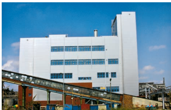
Instalacja granulacji mechanicznej nawozów azotowych w Azotach Tarnów

WITOLD SZCZYPIŃSKI: Nawozy saletrzan są u nas wytwarzane znaną metodą „granu-