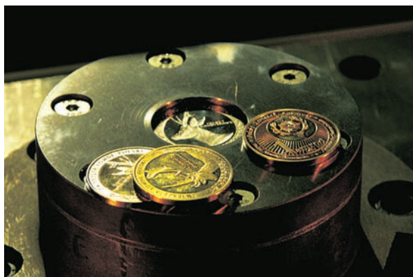
Pierścień menniczny z monetami

pamiątkowych, w tym również medali dla potrzeb imprez sportowych czy kulturalnych. W przypadkach produkcji numizmatów lokalnych Mennica uczestniczy