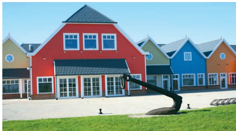
Fashion House Outlet Centre w Gdańsku

Poza tym, firma współpracuje m.in. z Jeronimo Martins, właścicielem sieci handlowej Biedronka i z grupami inwestycyjnymi AIG/Lincoln Polska, SEGRO w zakresie nadzorowania proce-