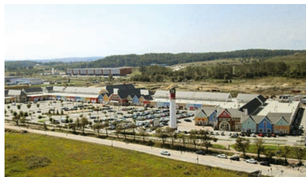
Fashion House Outlet Centre w Gdańsku

BUDOWNICTWO SPOŁECZNE Mieszkania na wynajem po umiarkowanych cenach