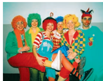
Wolontariusze Fundacji „Dr Clown”

W ciągu kilkunastu lat spółka z rodzinnej firmy przekształciła się w przedsiębiorstwo, zatrud-