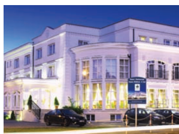
Hotel Lubicz**** Wellness & SPA w Ustce

spa@hotel-lubicz.pl, tel. +48 59 815 44 09