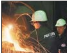
Remont urządzeń energetycznych

W 2006 r. przeprowadziliśmy kompleksowy remont kotła w elektrowni Jämschwalde w Niemczech – dodaje prezes. – Obecnie nasi