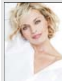
Małgorzata Foremniak - jedna z najbardziej znanych polskich aktorek filmowych i teatralnych została ambasadorem marki Soraya.