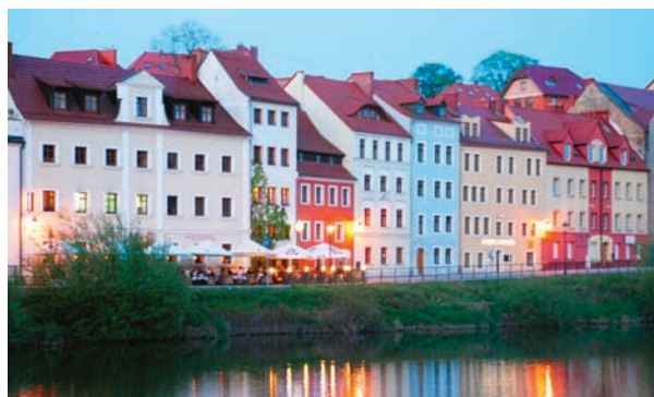
Zgorzelec – Przedmieście Nyskie

Dzisiaj inwestorami są także same samorządy. Można nawet powiedzieć, że inwestorami największymi w Polsce, bo to właśnie one dysponują funduszami, w znacznej części pochodzącymi ze środków unijnych, dzięki którym są budowane i remontowane drogi, przygotowywane tereny dla inwestorów zewnątrz-