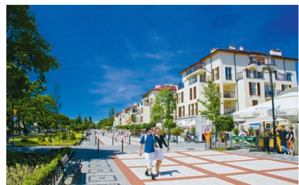
Nowa promenada w Świnoujściu

– Jedną z najbardziej atrakcyjnych inwestycji turystyczno-rekreacyjnych Świnoujścia jest