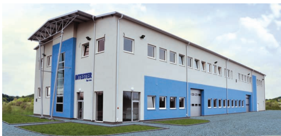
Nowa hala produkcyjna

Produkcja rozdzielni szafowych opiera się na systemie funkcjonalnym, dedykowanym do szaf modułowych, służącym do dystrybucji energii niskiego napięcia, zarówno w środowisku przemysłowym, jak i komercyjnym. Wszystkie komponenty systemu modułowego zostały zaprojektowane i przetestowane dzięki analizie charakterystyk urządzeń. Takie podejście do budowy rozdzielni gwarantuje wysoki poziom niezawodności w różnych systemach oraz zapewnia maksimum bezpieczeństwa dla obsługi. Rozdzielnie w tym systemie są kompatybilne z urządzeniami innych marek, a konserwacja i przeglądy są łatwe do wykonania ze względu na dobry dostęp do aparatury i dzięki wykorzy-