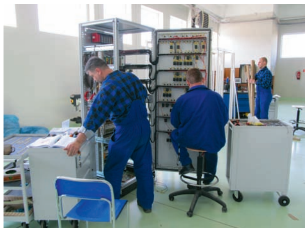
Prefabrykacja szafy sterowniczej

FUNDUSZE POŻYCZKOWE Atrakcyjne pożyczki dla mikro i małych firm