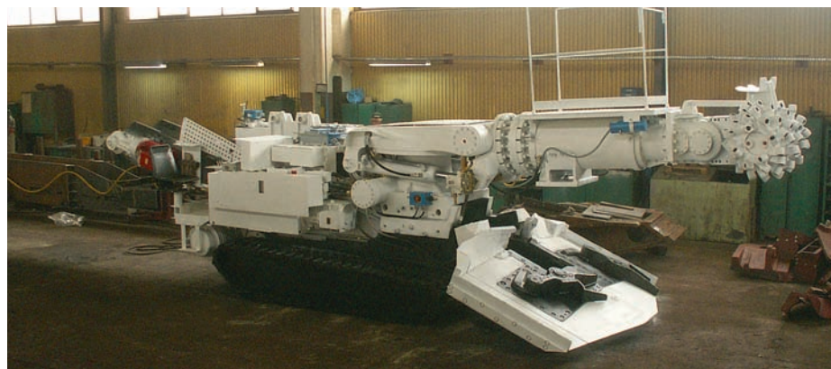
Kombajn górniczy AM50

uczujemy nad doposażeniem naszej firmy w innowacyjne, zrobotyzowane stanowisko do produkcji i remontów głowic urabiających, częściowo dofinansowane ze środków