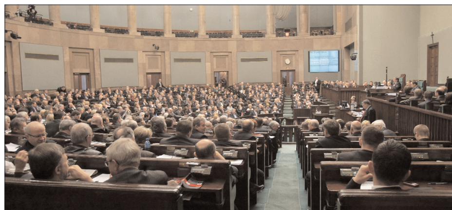
Przed parlamentarzystami stoi konieczność zmiany polskich przepisów, aby umożliwić wprowadzenie w Polsce wspólnej waluty

W ejście Polski do strefy euro będzie wymagało wielu zmian w prawie. Przede wszystkim konieczna jest nowelizacja Konstytucji RP oraz modyfikacja ustaw o Narodowym Banku Polskim, o Najwyższej Izbie Kontroli i Bankowym Funduszu Gwarancyjnym. Inne niezbędne zmiany związane z euro powinny zostać uregulowane w tzw. ustawie horyzontalnej. Jak wynika z raportu Prawne przygotowania do wejścia Polski do strefy euro, przygotowanego na zlecenie NBP, w ustawie horyzontalnej powinien zostać określony np. czas obowiązywania obywateli walut jednocześnie oraz wyjątki od obowiązku przyjmowania obu walut za podstawę rozliczeń i sposobu wymiany banknotów.