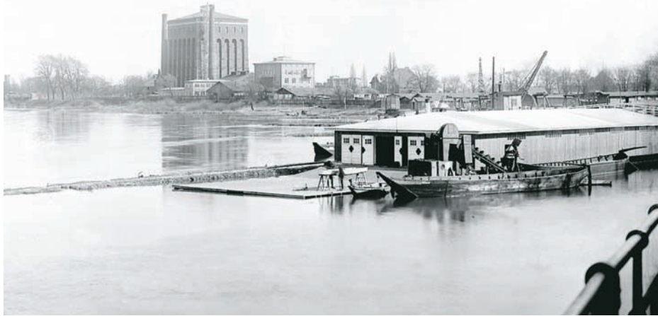
Wieża Ciśnień MPWiK we Wrocławiu – widok od Mostu Grunwaldzkiego, 1929 r.

nad Odrą koła wodnego, a w miarę postępu technicznego wprowadzono pompy tłokowe.