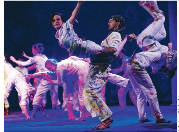
Pracownicy Capgemini w spektaklu „Piotruś Pan”, Teatr Ludowy w Krakowie

trzeb biznesowych klienta. Wartością dodaną współpracy z Capgemini jest możliwość skorzystania z ujednoliconych, globalnie zweryfikowanych metodologii, skracających czas realizacji projektu oraz możliwość korzystania z doświadczeń i zasob-