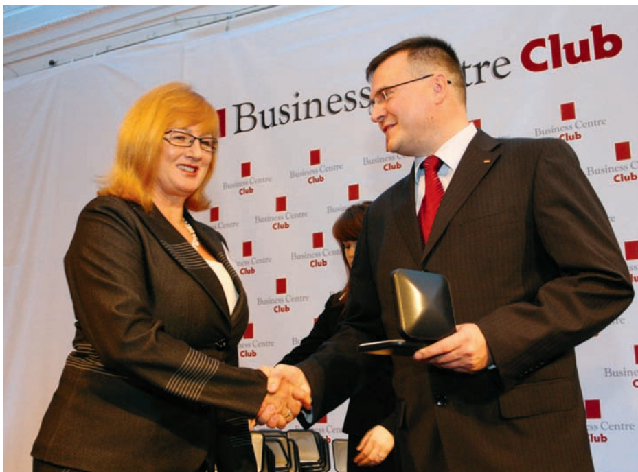
Uroczystość wręczenia Medalu Europejskiego dla DZT Service Sp. z o.o.

Każda inicjatywa sportowa skierowana do najmłodszych może liczyć na finansowe i organizacyjne wsparcie DZT Service Sp. z o.o.