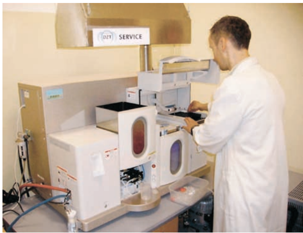
Akredytowane laboratorium DZT Service Sp. z o.o. w Częstochowie