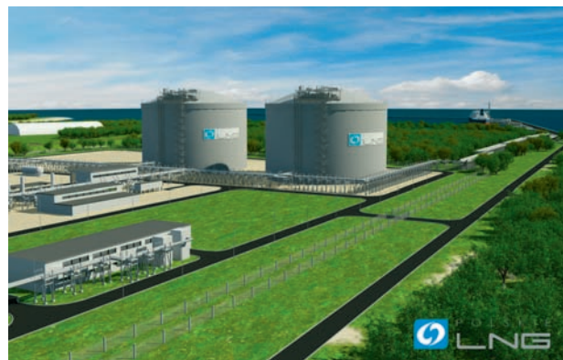
Makieta terminalu LNG w Świnoujściu

Gaz łupkowy jest niewątpliwie sensacją ostatnich miesięcy. Jeżeli faktycznie analizy potwierdzą opłacalność jego eksploatacji na skalę przemysłową mamy szansę na rozwój własnego wydobycia gazu, co całkowicie przewartościuje dotychczasową politykę energetyczną kraju. W przyszłości korzyści płynące w pierwszej kolejności z budowy terminalu LNG, a w dalszej – z potencjalnego wydobycia gazu łupkowego są dobrą perspektywą dla Polski, ponieważ niosą za sobą ogromny potencjał polityczny i gospodarczy. Szczególnie w kontekście nowej koncepcji budowy terminalu rewersyjnego czyli przystosowanego do transportu nadwyżek gazu z Polski do krajów sąsiednich. Przed nami rewolucja w myśleniu o polskiej polityce energetycznej: z importera uzależnionego od jednego dostawcy, mamy szansę zmienić się w największego w regionie eksportera dzięki dodatkowym źródłom surowca pochodzącym z wykorzystania terminalu LNG oraz zwiększonego własnego wydobycia.