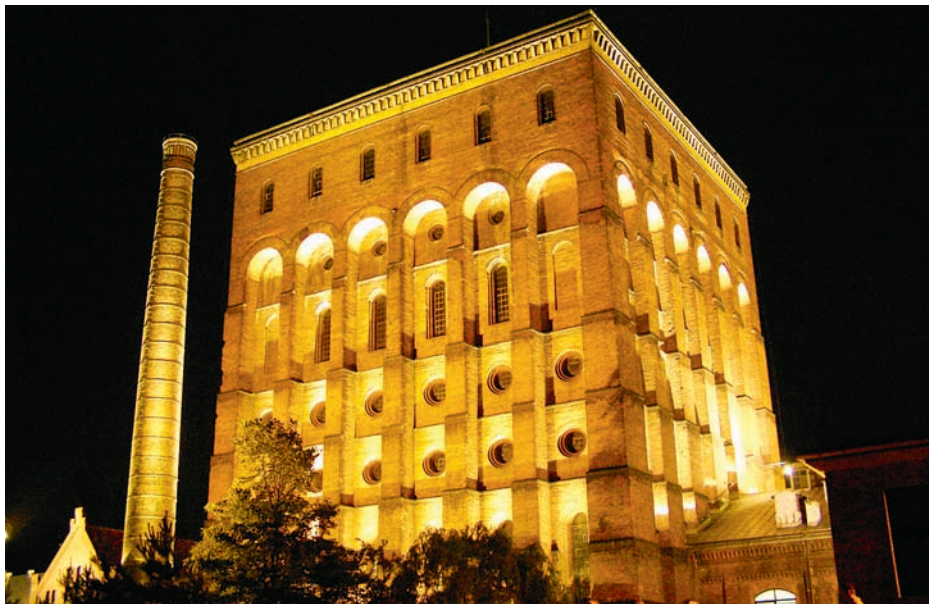
Zabytkowa Wieża Ciśnień MPWiK we Wrocławiu