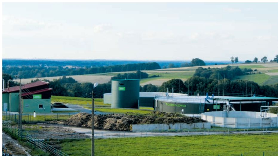
Agrobiogazownia w Gospodarstwie Kostkowice