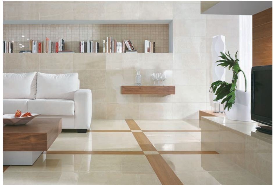
Kolekcja Crema Marfil by My Way

Kolejnym krokiem realizowanym w ramach planu inwestycyjnego jest unowocześnienie zakładu produkcyjnego Ceramiki Paradyż Sp. z o.o. w Opocznie. Inwestycja ta pochłonie łącznie 25 milionów zł. Działania prowadzone są od 2010 r. i obejmują modernizację zakładu w kierunku produkcji nowych formatów płytek ceramicznych w ofercie marki Paradyż – obecnie są to nowości rynkowe na rok 2011 – jak również wytwarzania dekoracji szklanych w postaci mozaiki, listew i insertów oraz łączenia elementów