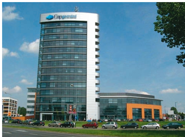
Biuro Capgemini w Krakowie

społu projektowego, czyli osób pracujących po stronie klienta, partnerów i własnych pracowników. Skoordinowanie tych wszystkich czynników w przypadku dużych, skomplikowanych projektów nie jest zadaniem trywialnym, zwłaszcza przy nieustannie zwiększających się ograniczeniach budżet-