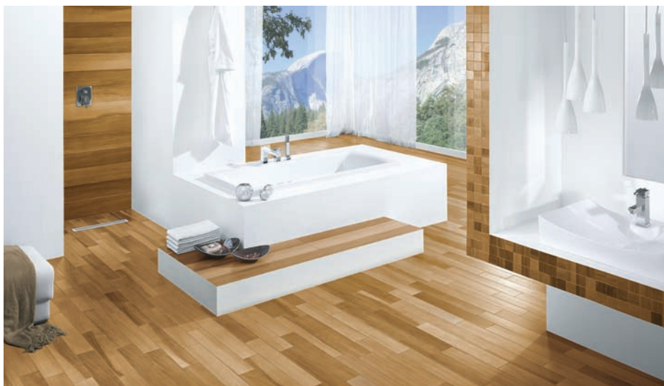
Kolekcja Noce by My Way