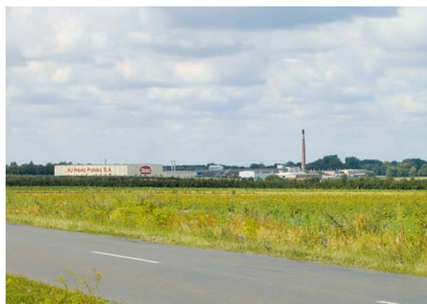
Tereny inwestycyjne – Gmina Krobia czeka na inwestorów

czemu w planie zagospodarowania przestrzennego, do działań priorytetowych należy zagospo-