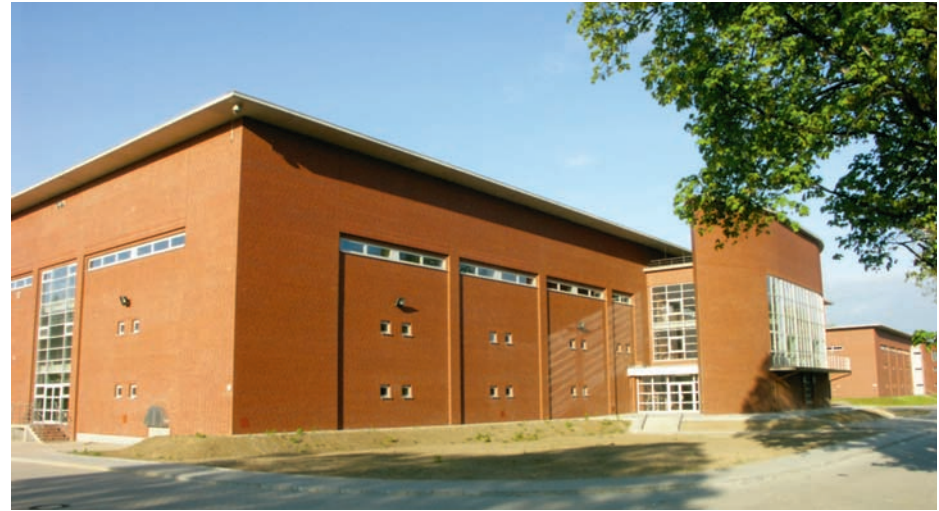
Nowy budynek filtrów węglowych Zakładu Uzdatniania Wody „Na Grobli” MPWiK we Wrocławiu

Cele jakie stawia przed sobą spółka, to nie tylko budowanie firmy, doskonale spełniającej oczekiwania klientów, ale również przyjaznej środowisku. MPWiK przywiązuje dużą wagę do ochrony środowiska natural-