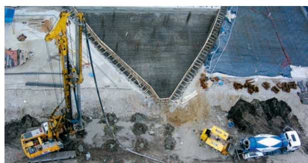
Wzmocnienie słabego podłoża organicznego kolumnami CMC pod 14-kondygnacyjny budynek w Warszawie

przemysłowego oraz użyteczności publicznej w Polsce. Dzięki doświadczeniu swoich wyspecjalizowanych inżynierów, firma podejmuje każde, nawet najtrudniejsze wyzwanie.