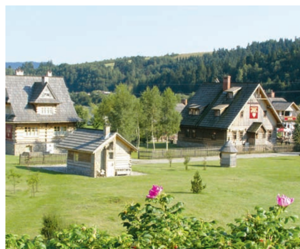
Chaty regionalne, zrewitalizowany kompleks Polana Sosny

ZEW Niedzica S.A. spełnia nie tylko znaczącą rolę dostawcy energii elektrycznej dla regionu, ale prowadzi również zaawansowaną działalność turystyczną, dysponując bogatą bazą noclegowo-gastronomiczną i rekreacyjną. Spółka dysponuje hotelem*** „Pieniny”, położonym nad potokiem Niedziczanka, gdzie z dala od ruchu ulicznego, oferuje ponad 100 miejsc noclegowych. Na stoku góry Tabor, z widokiem m.in. na Jezioro Sromowickie, Pieniny i Tatry, położony jest „Dom Wypoczynkowy Pod Taborem”. Ponadto do majątku elektrowni wliczany jest również zrewitalizowany ośrodek rekreacyjny „Polana Sosny”, w skład którego wchodzi wille regionalne: Chata Spiska, Chata z Kir, Restauracja „Dwór”, piaszczysta plaża na brzegu rzeki Dunajec, Camping*** (wyróżniony tytułem „Mister Camping” przez Polską Federację Campingu i Caravaningu) oraz Ośrodek Narciarski „Polana Sosny”. Cały kompleks został uhonorowany przez Fundację Partnerstwo dla Środowiska nagrodą „Czysty