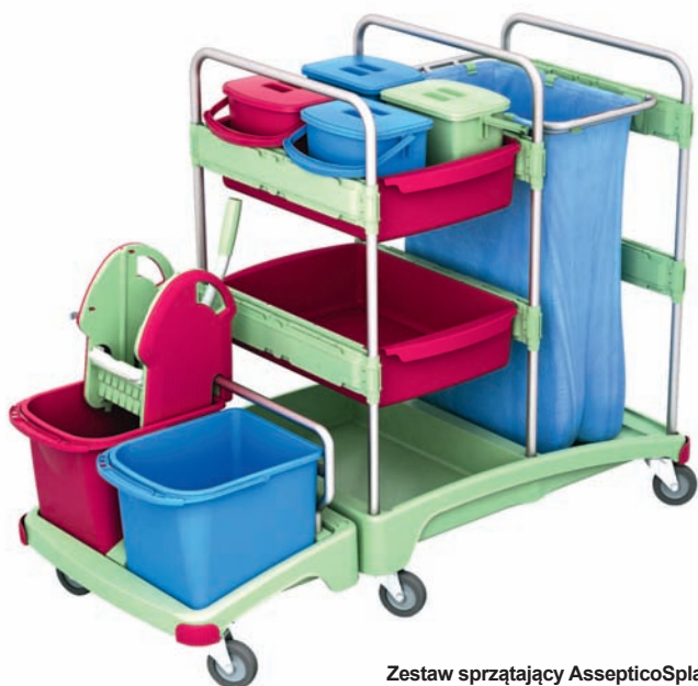
Zestaw sprzątający AssepticoSplast®

– grupa ergonomicznych i zaawansowanych zestawów, zaprojektowana w celu optymalizacji procesu sprzątania na mokro. Każdy element został przetestowany w ekstremalnych warunkach. Produkty posiadają wydłużony czas eksploatacji dzięki zastosowaniu najwyższej klasy tworzyw sztucznych w połączeniu ze stałą szlachetną. Niepowtarzalne wzornictwo spełnia wymagania obiektów o najwyższych standardach estetycznych.