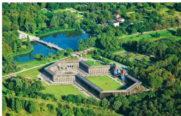
Łężnia w Parku Solankowym w Inowrocławiu

Stawiamy też na rozwój infrastruktury sportowo-rekreacyjnej – zmodernizowaliśmy krytą pływalnię, wybudowaliśmy „Wodny Park”, przebudowujemy stadion miejski, na terenie miasta powstało wiele boisk wielofunkcyjnych oraz dwa sztuczne lodowiska. Chcemy, aby Inowrocław stał się zapleczem sportowym i rehabilitacyjnym dla sportowców, zwłaszcza, że nasze sanatoria specjalizują się w leczeniu i rehabilitacji narządów ruchu. Stadion wpisany został na listę obiektów o strategicznym znaczeniu dla rozwoju lekkoatletyki. Przede wszystkim jednak obiekty te mają służyć mieszkańcom Inowrocławia.