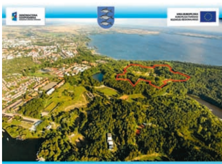
Giżycko z lotu ptaka – Twierdza Boyen

Twierdza Boyen to XIX-wieczny obiekt militarny, który wraz z okolicą zajmuje 42 ha i stanowi niewątpliwie atrakcyjny teren inwestycyjny Giżycka. Twierdza stanowi przykład pruskiej szkoły fortyfikacyjnej z połowy XIX w., jest jednocześnie jednym z najlepiej zachowanych zabytków architektury obronnej XIX wieku w Polsce.