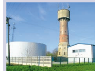
Stacja uzdatniania wody w Pyrzycach